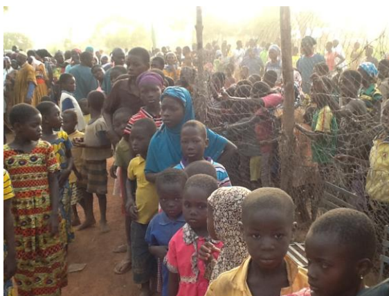
Kerstfeest 2014, kinderen wachten geduldig op hun feestmaaltijd.

Het bestuur wil graag alle personen en organisaties, die zich hebben ingezet voor de allerarmsten in Noord-Ghana, hartelijk bedanken en hoopt dat zij ook in de toekomst op uw steun kan rekenen!