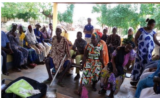
Patiënten aan het wachten op de OPD