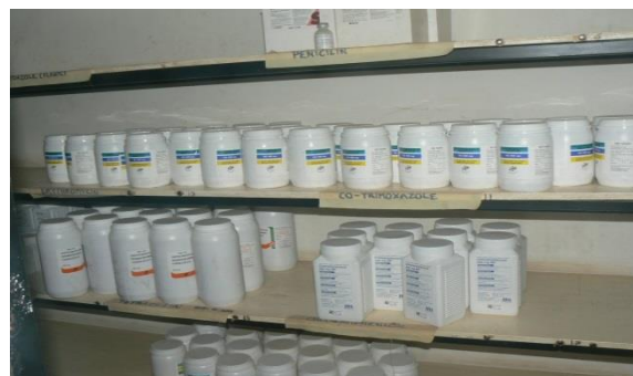
Overzicht van een deel van de bestelde medicatie